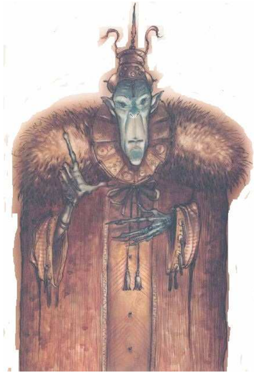
Géron chef de la rébellion mercane l'extérieur de Sigil.

Le fait que soit massé dans un espace exigu tant de monde est générateur de violences. Les bagarres qui finissent par des morts sont quotidiennes. Le quartier arrivants est un véritable mouvoir, encerclé par des hauts murs et les milices de tous les quartiers contiguës. La prévôté assure la milice dans cette partie de la ville. Le capitaine qui dirige ces forces lourdement armées s'appelle Gérard.