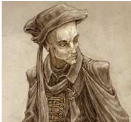
Skall, des Cherche-Mort

Fell le dabus : Fell était déjà né il y a 1500 ans. Il était un fidèle serviteur de La Dame et fait partie de ceux qui l'accompagnent dans le quartier commun lors de la dernière scène. Le reconnaître parmi les dabus nécessite un jet de détection DD30. Il ne comprendra pas la demande des pjs et ne sera pas capable de leur répondre. Il fait trop partie du collectif des dabus à cette époque pour accepter quelque responsabilité personnelle.